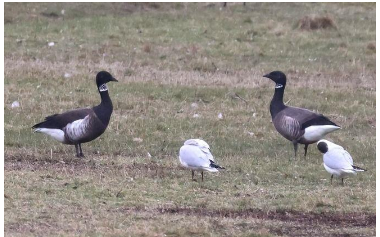
links Pazifische Ringelgans, rechts Dunkelbäuchige Ringelgans

Trotz der schlechten Wetterprognose wurde es für ein kleines treues Ringelgansfan-Grüppchen ein runder Halligbesuch (fast ganz ohne Regen).