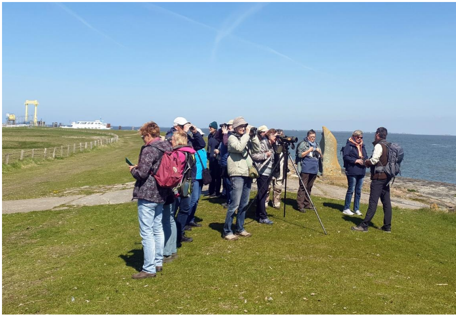
Kleiner „Ringelgans-Kiek“ auf Hallig Hooge