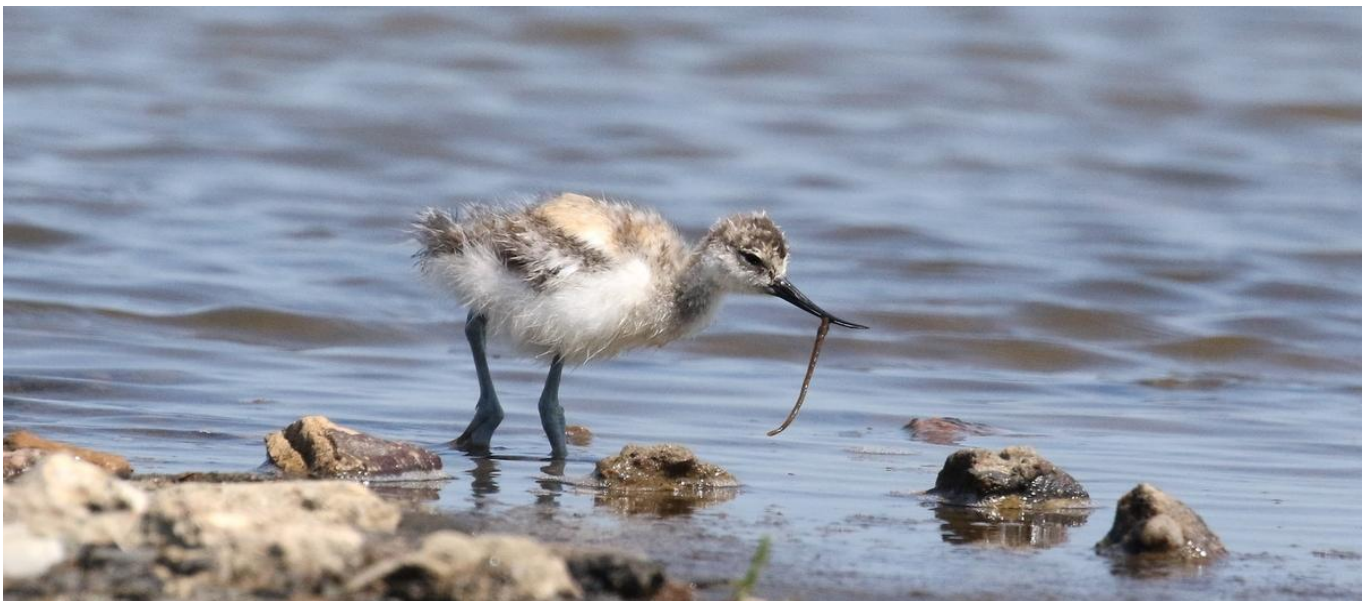
Säbelschnäbler-Küken mit erster Beute